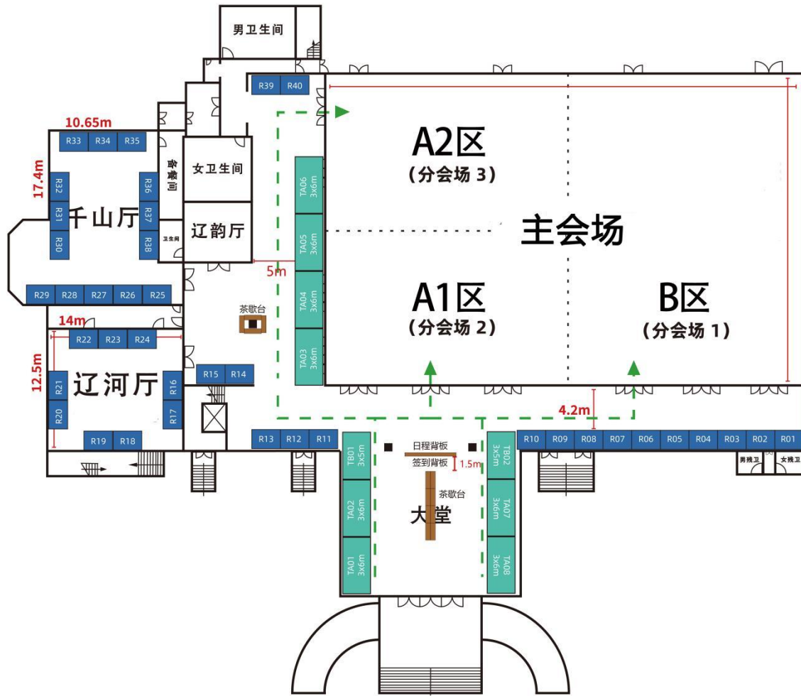
第十九届中国实验动物科学技术年会展位示意图 (室内1F)